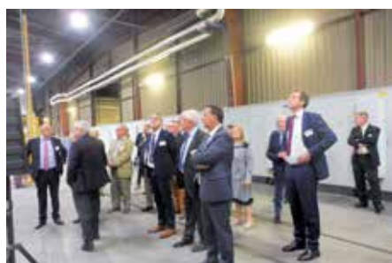
Chez Swiss Krono

J-L R : Si nous mettons en œuvre les actions nécessaires au développement de nos entreprises, nous souhaitons également attirer de nouvelles, proposer une offre résidentielle diversifiée, une offre éducative de qualité et une offre de santé à la hauteur de ce que sont en droit d'attendre les Sullylois et les futurs habitants de notre territoire. Ce sont des projets à long terme sur lesquels nous portons toute notre énergie. À titre d'exemple, nous travaillons actuellement sur un projet visant à développer des passerelles économiques et culturelles avec un pays francophone. Comme vous pouvez le constater, nous gardons notre vision d'ouverture sur l'avenir en ligne de mire.