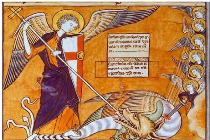
Lambert de Saint-Omer, enluminure du Liber Floridus, Diocèse de Cambrai, XIV e siècle, BNF, Ms lat. 8865, f. 39r

(*) Une publication de CCLIC, www.ccllic.fr