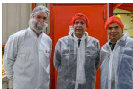
En visite chez Rougier

J-L R : En effet, nous avons tous à gagner à travailler ensemble vers un même objectif : que notre territoire puisse prospérer. Quand ces entreprises investissent chez nous, cela garantit un niveau d'emploi important. Nous avons vraiment énormément de chance d'avoir des entrepreneurs qui continuent à investir et à embaucher.